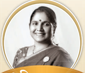
श्रमिक एल्यार द्विदशक वर्षपूर्ती